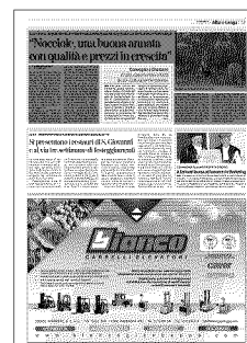
Un gruppo di raccoglitori di nocciole