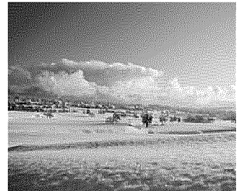
La valle di Non versione invernale

foreste e piccoli borghi contadini. Grazie alla sua particolare conformazione morfologica la Val di Non è stata recentemente ribattezzata la "Valle dei Canyon". Questi fantastici spettacoli naturali, rimasti per secoli nascosti ed inaccessibili, sono stati recentemente riscoperti e sono oggi percorribili in suggestivi percorsi costruiti nella roccia. Due di questi percorsi, il