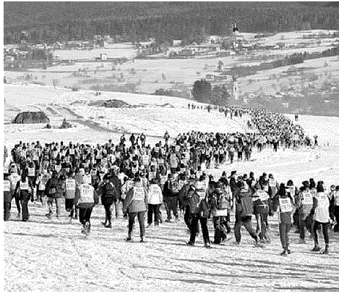
Il serpentine di concorrenti della Ciaspolada

Dici Valle di Non e pensi alle mele che hanno fatto la fortuna di questa vallata. Sua maestà la mela, unica Dop in tutta Italia, la sua qualità è garantita dal marchio dop Melinda che raccoglie oltre cinquemila famiglie contadine. Il pregiato formaggio grana trentino, principe del gusto e la tipicissima mortandela affumicata, salume presidio slow food. Le produzioni tipiche della Val di Non sono tante e diverse: i salumi e i formaggi, ma anche i doni genuini della terra come la frutta (mele, pere e piccoli frutti del sottobosco) o i dolci tradizionali come il brezdel, lo strudel o la torta di mele delle massie della valle. Per far apprezzare all'ospite queste piccole e preziose produzioni artigianali è nata la Strada della Mela e dei Sapori della Val di Non e di Sole. Sono tanti gli appassionati presenti in questo periodo in Valle di Non in quanto domenica si disputa la Ciaspolada. Si tratta di una storica manifestazione sportiva sulla neve con ai piedi le "ciaspole" o racchette da neve lungo un percorso di 7 km circa. La gara è la più particolare tra le manifestazioni invernali organizzate in Trentino e