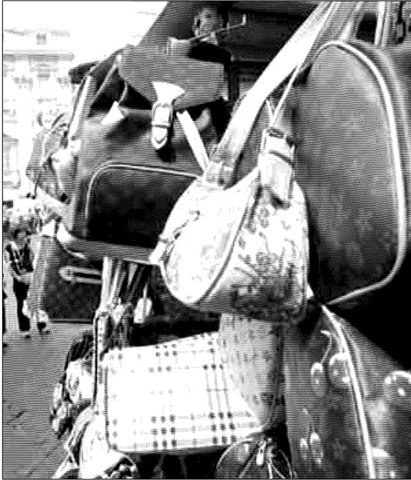
Borse contraffatte con il logo delle principali griffe, vendute alle bancarelle