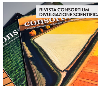
RIVISTA CONSORTIUM DIVULGAZIONE SCIENTIFICA