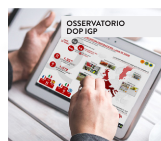
OSSERVATORIO DOP IGP