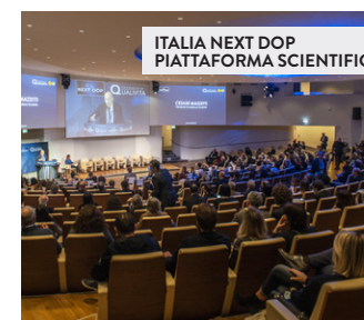
ITALIA NEXT DOP PIATTAFORMA SCIENTIFICA