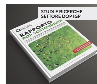
STUDI E RICERCHE SETTORE DOP IGP