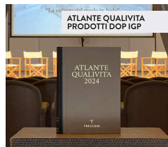
ATLANTE QUALIVITA PRODOTTI DOP IGP