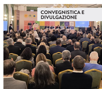
CONVEGNISTICA E DIVULGAZIONE