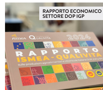
RAPPORTO ECONOMICO SETTORE DOP IGP