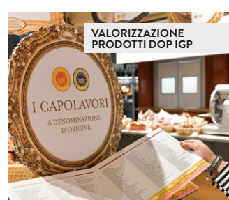
VALORIZZAZIONE PRODOTTI DOP IGP