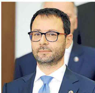
STEFANO PATUANELLI MINISTRO DELL'AGRICOLTURA

Lo choc rischia di compromettere definitivamente la sopravvivenza delle imprese