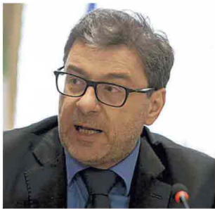
GIANCARLO GIORGETTI MINISTRO DELLO SVILUPPO ECONOMICO